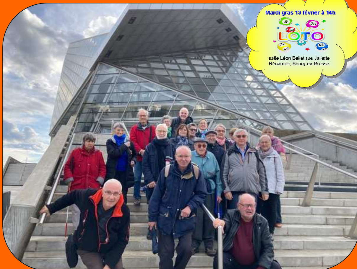
Les membres de l'UTR-01 devant le musée des Confluences à Lyon le 9 novembre 2023.